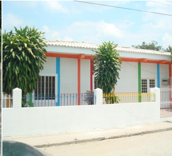
Foto 2. Infraestructura educativa infantil. Hogar infantil nuestra Señora de la Candelaria