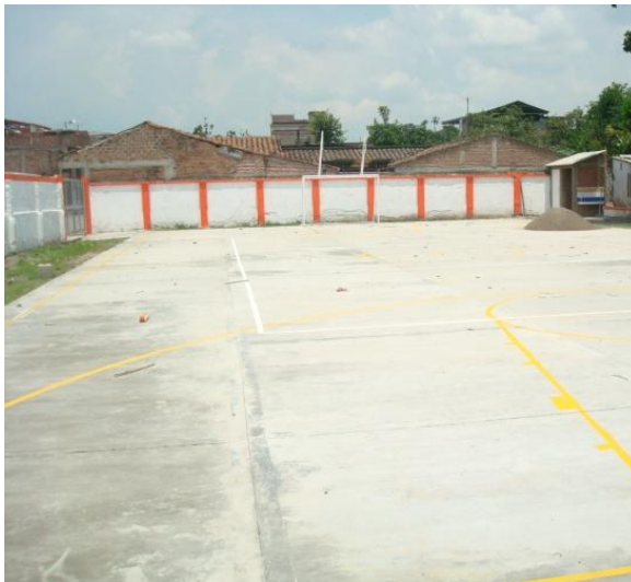
Foto 3. Infraestructura deportiva. Cancha comunitaria barrio Gaitán.