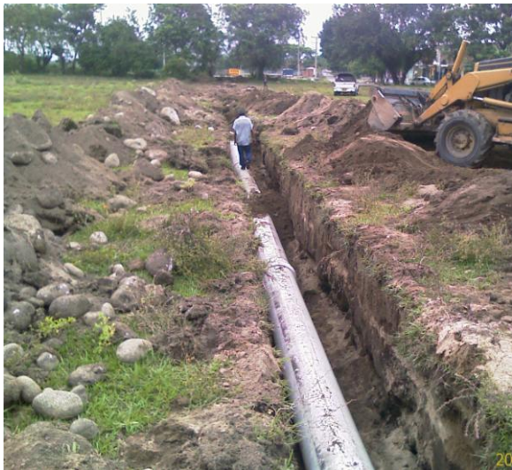
Foto 4. Infraestructura de servicios públicos. Acueducto regional para Candelaria.