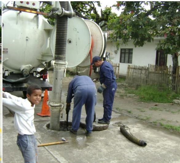
Foto 4. Saneamiento básico. Mantenimiento constante de redes de alcantarillado.