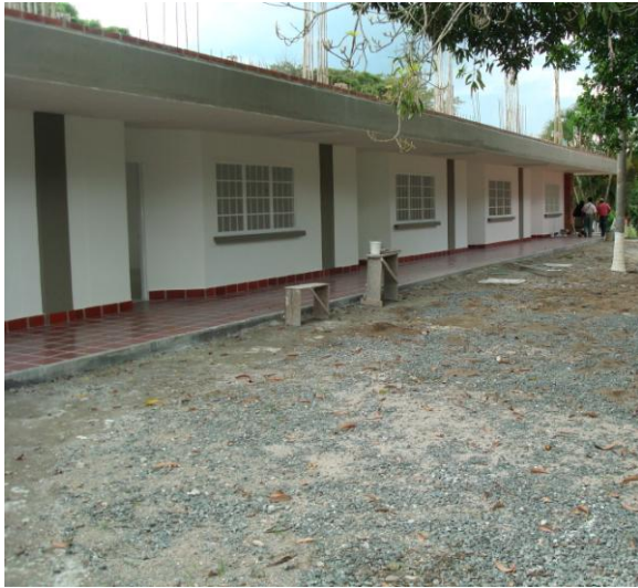
Foto 1. Infraestructura educativa infantil. Sede Campestre educativa El Paraíso Villagorgona.