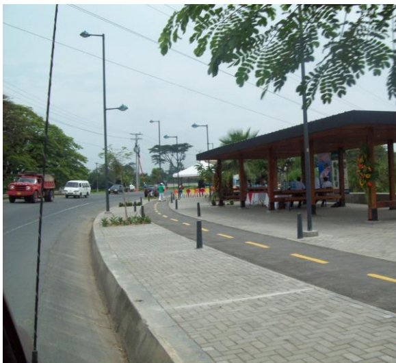
Foto 7. Espacio público de carácter regional. Malecón Turístico Juanchito.