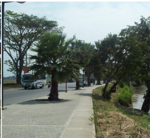
Foto 6. Espacio público de carácter regional. Malecón Turístico Juanchito.