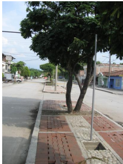
Foto 5. Espacio público urbano. Separador de la avenida en Candelaria.